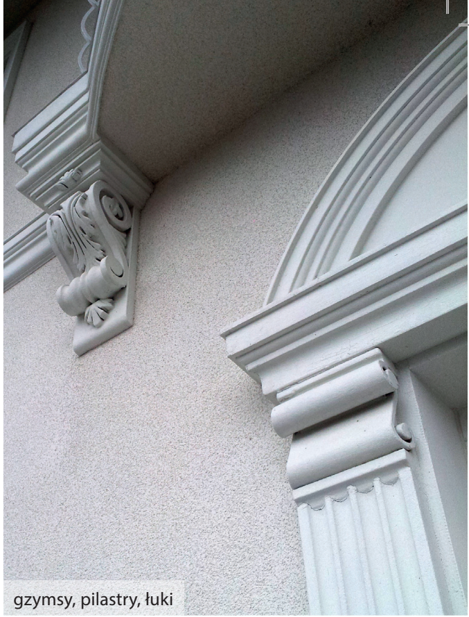
gzymсы, pilastry, łuki