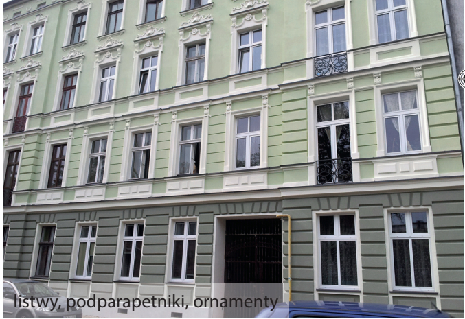
listwy, podparapetniki, ornamenty