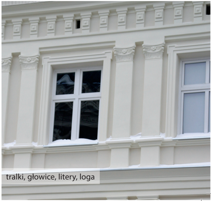
tralki, główce, litery, loga